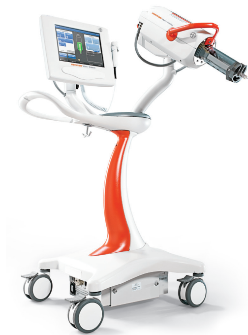
MEDRAD® Mark 7 Arterion, пьедестальная конфигурация

*При условии использования функции Vflow (вариабельный поток)