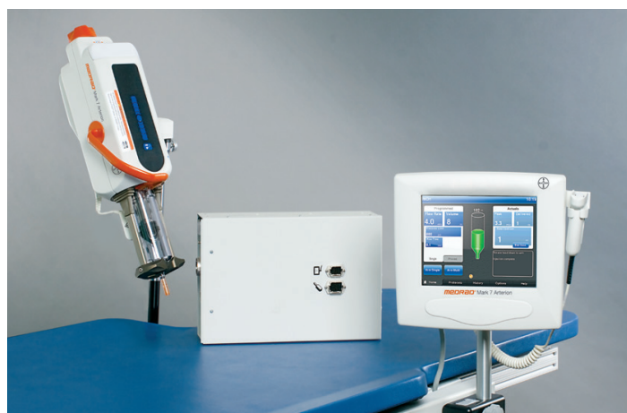
MEDRAD® Mark 7 Arterion, настольная конфигурация

Четкое направление. ➤ От диагностики к лечению.